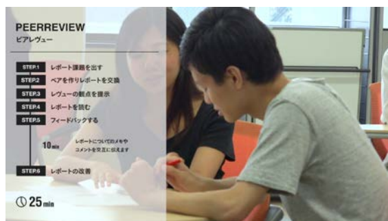
図1 アクティブラーニング動画の一場面

アクティブラーニングの方法であるポスターツアー、ジグソー法、ピアレビューに関して、その方法を学べる動画を作成しました(図1)。東大TVにて年度内に公開いたします。