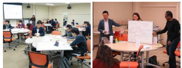
図2 セミナーの様子

BLP は立教大学経営学部経営学科の1年生の春学期から3年生の春学期まで、5学期2年半をかけて行われるプログラムであり、立教大学に経営学部が設置された2006年から開始されました。「権限がなくとも発揮できるリーダーシップの涵養」を目指しており、自ら目標設定をして、自らすすんで前に立ち、さらに同僚を支援する学生を育むことを教育目標としています。アクティブラーニングを取り入れた授業設計で、産学連携のプロジェクトを実行する授業とスキルを強化する授業で構成されています。1年生は春学期に「リーダーシップ入門 (BL0)」の受講を通して課題解決のプロジェクトを行い、秋学期には BL1 で論理的思考力を養うため、ライティングスキルを強化し