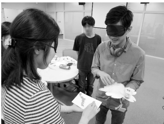
図4 ワークショップの様子

授業では、目の見えない人にとって自分を表現する「名刺」とはどのようなものかを考えて制作する「見えない名刺をデザインするワークショップ」を実施して頂きました。普段、名前や肩書きが載っているものと何となく思っている名刺ですが、目が見えない人に自分のことを伝えると考えると、「出身地の形」を紙を切ってデザインする学生や、「所属サークルで使う道具」を表現する学生など多様な観点から名刺作成が行われ、お互いについての理解も深まりましたし、普段当たり前前に思っていることを疑う視野が養われました(図4)。